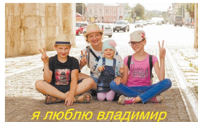
Я люблю Владимир