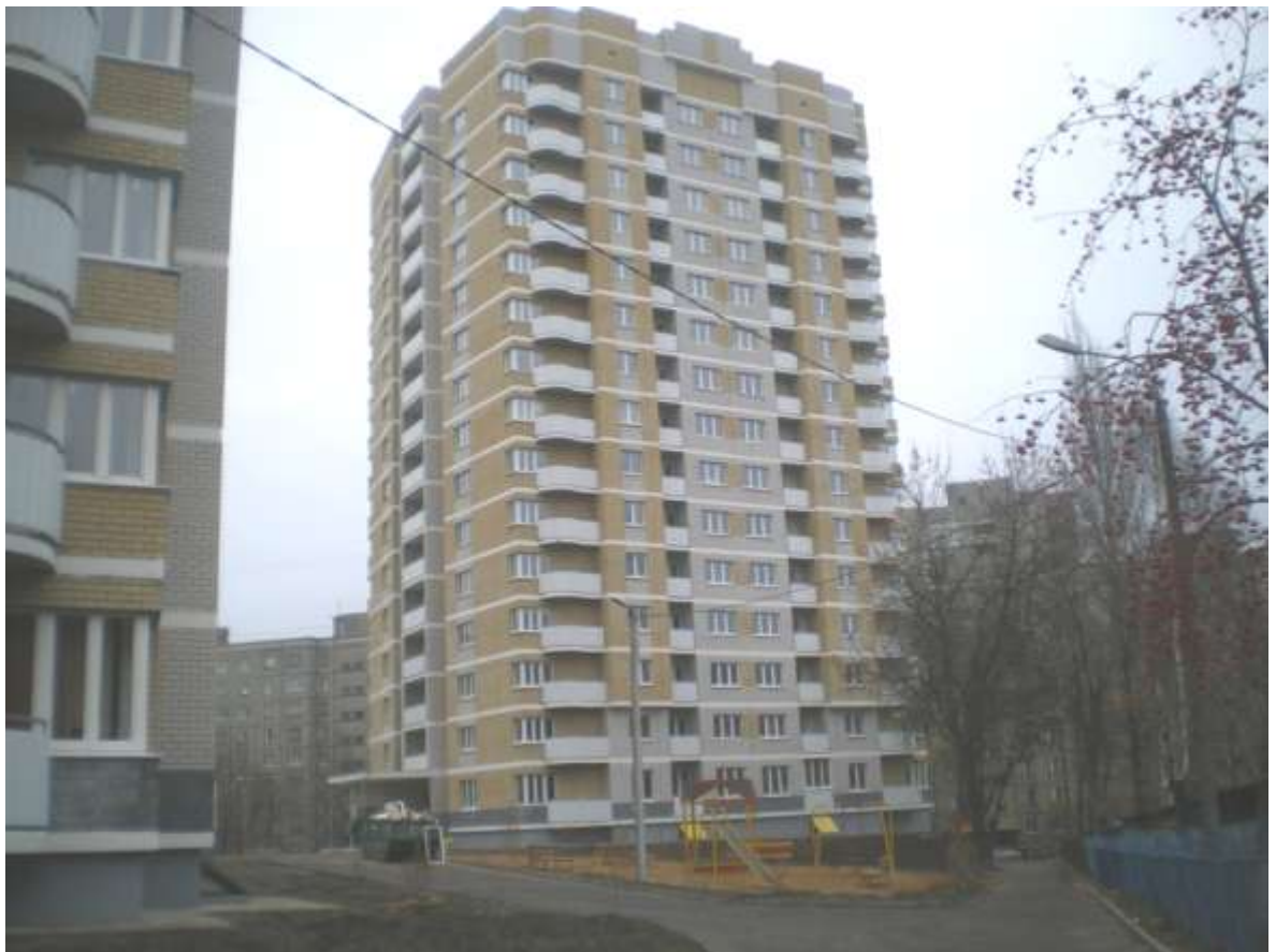
Три многоэтажных жилых дома по ул.Восточной, 80 (заказчик: ООО «Игротэк»)