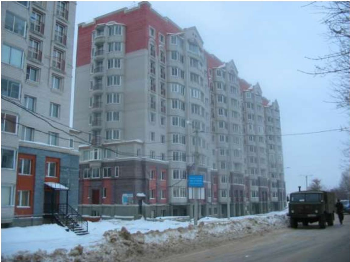
Жилой дом № 108 по ул.Северной (заказчик: ООО «Стройград»)