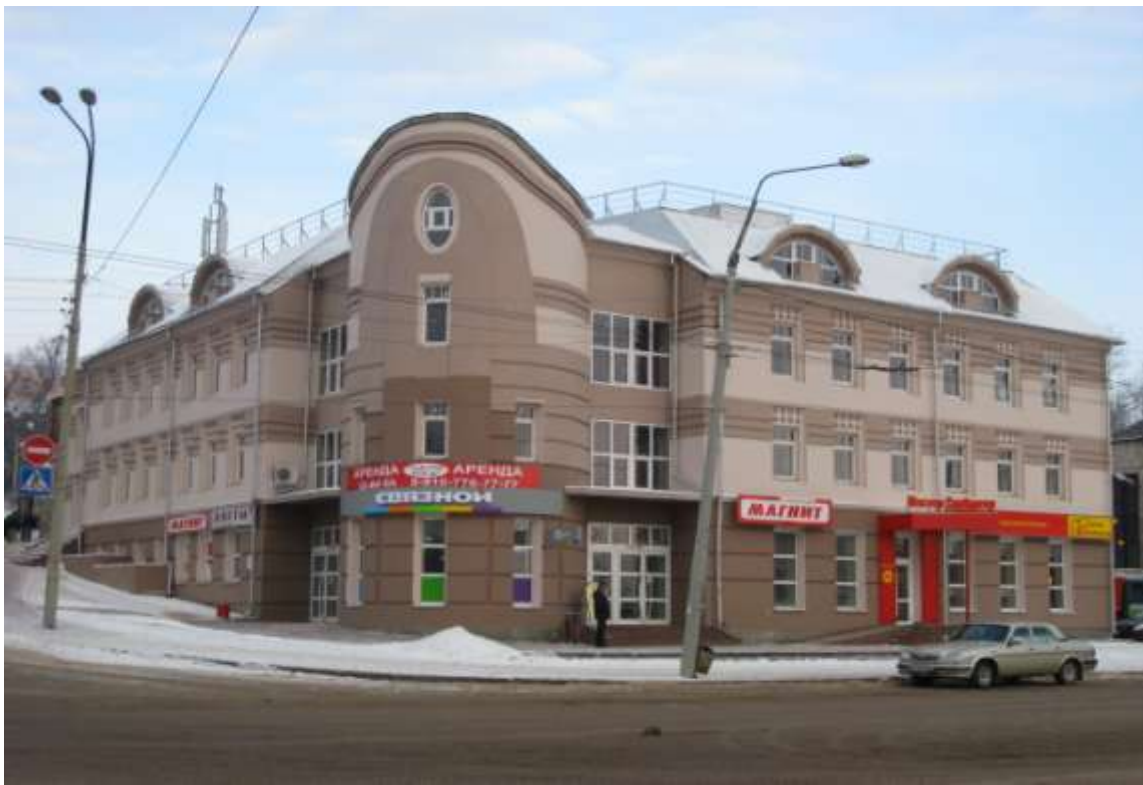
Спортивно-оздоровительный центр с блоком магазинов и аптечным пунктом, ул.Вокзальная, д.3 (заказчик: ООО «Андромеда»)