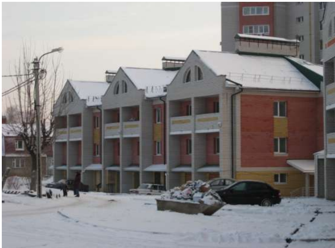
Блокированный жилой дом, ул.Офицерская, д.113 (заказчик: ООО «Гарант»)