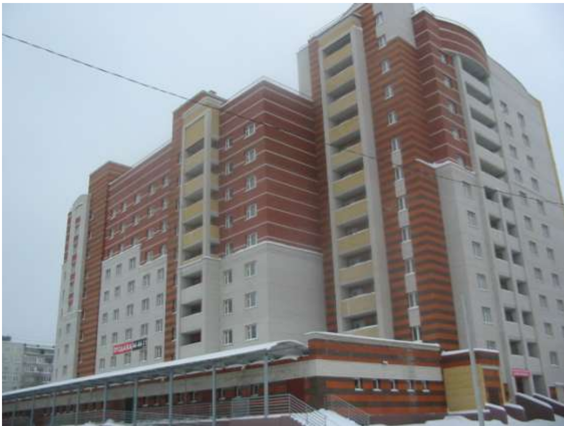
Жилой дом № 31 по ул.Соколова-Соколенка (заказчик: ОКС УВД)