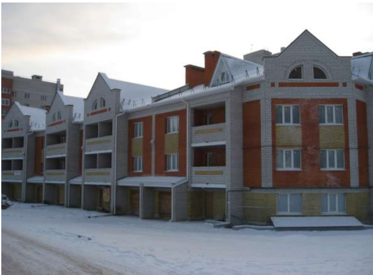
Блокированный жилой дом, ул.Офицерская, д.115 (заказчик: ООО «СМУ-33»)