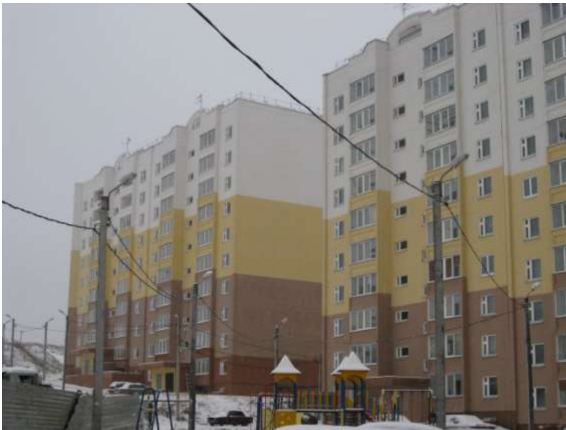
Многоквартирный жилой дом, ул.Фатьянова, д.16 (заказчик: ЗАО «Верхне-Волжская Инвестиционно-строительная компания»)