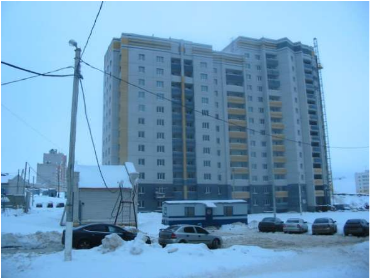
Жилой дом № 19-а, ул.Нижняя дуброва (заказчик: Владимирский городской ипотечный фонд)