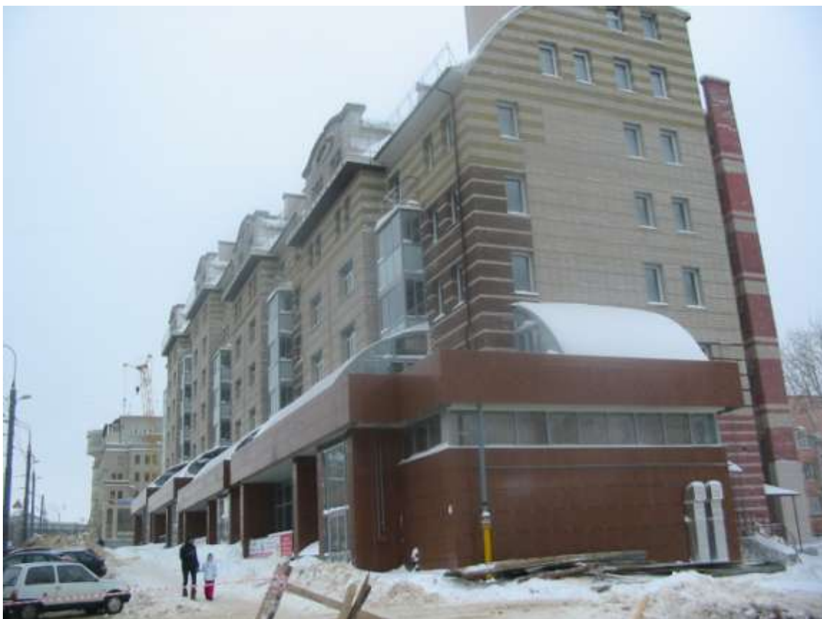
Жилой дом № 14 по ул.Студеная гора (заказчик: ЗАО «СпецТрансСтрой»)