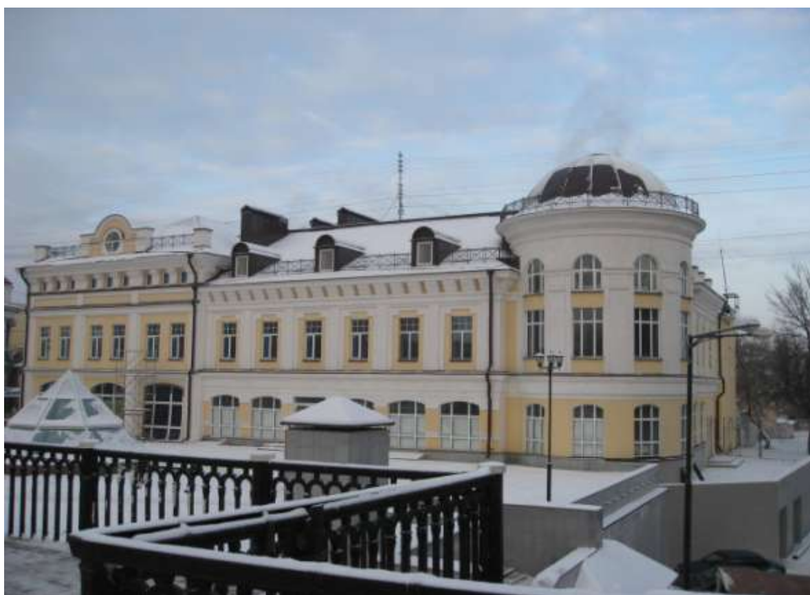
Объект комплексного обслуживания, ул.Гагарина, д.2-б (заказчик: ООО «Игротэк»)