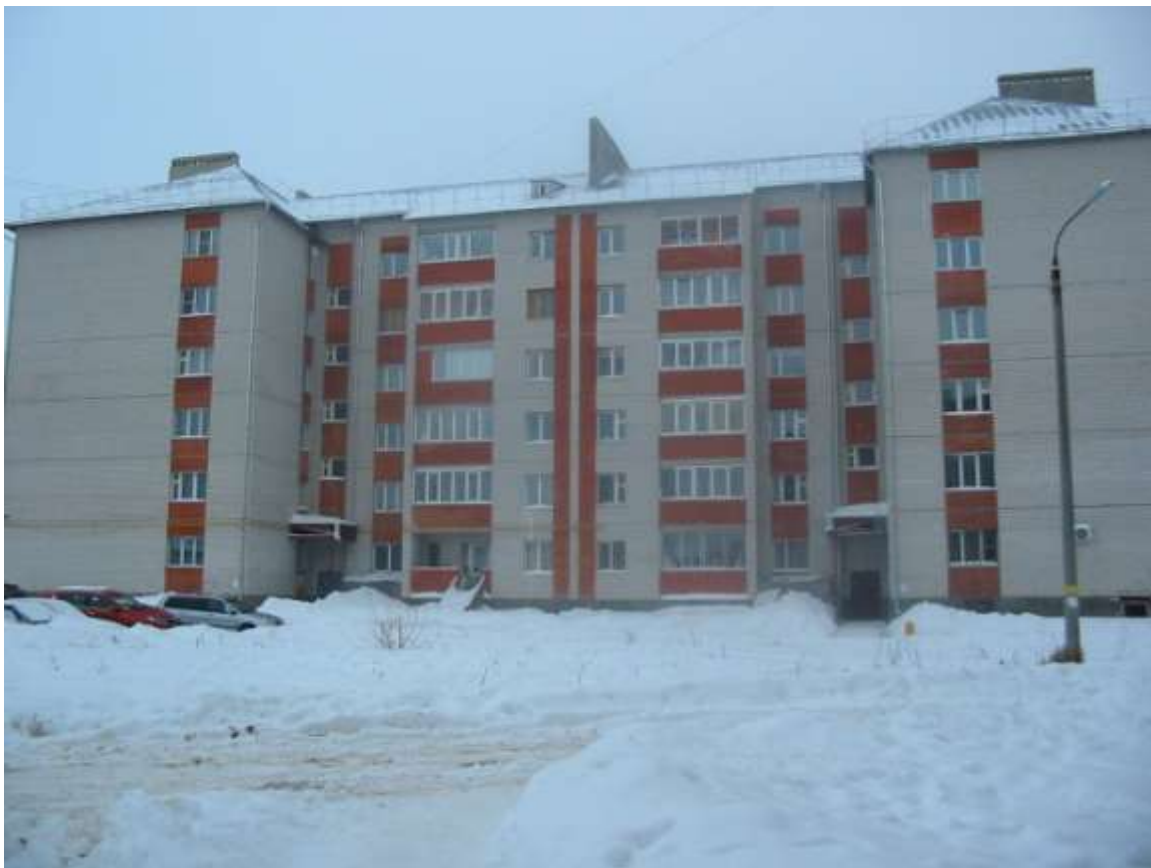
Жилой дом № 7, ул.Песочная (заказчик: ООО «Альтехно»)