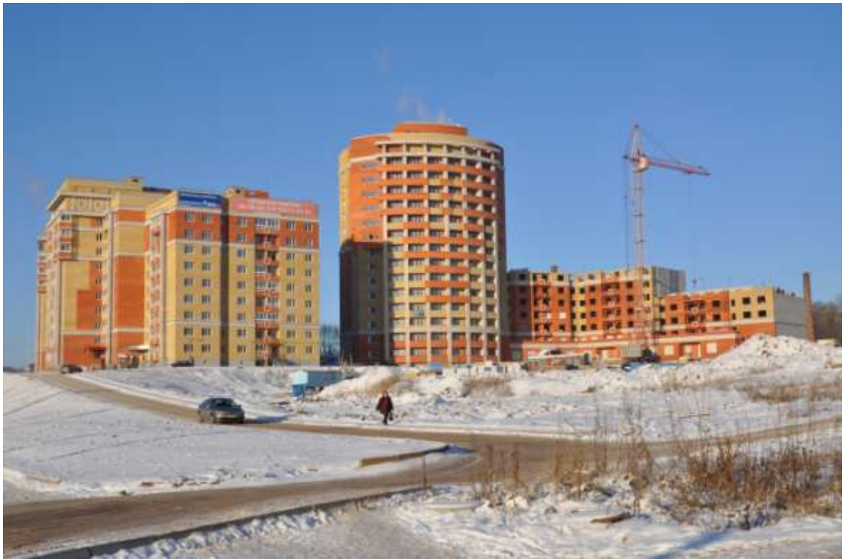
Жилые дома №№ 15, 15-а по ул.Мира (заказчик: ООО «ОблСкладКомплект»)