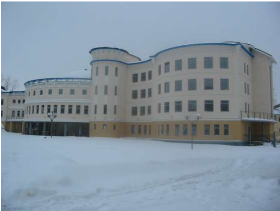
Городской планетарий, ул.Суздальская, д.11 (заказчик: Фонд «Сунгирь»)