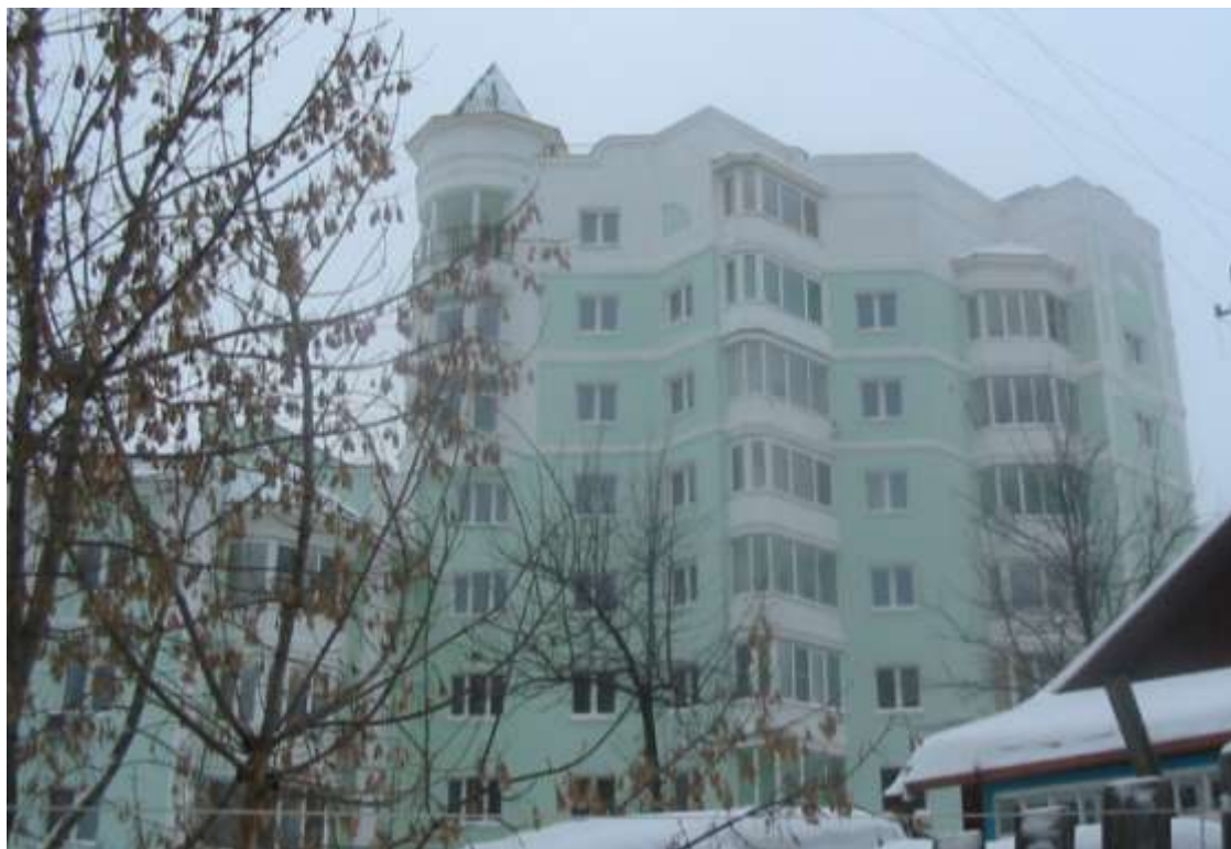
Жилой дом № 23 по ул.Сакко и Ванцетти (заказчик: ЗАО «Центрстройград»)