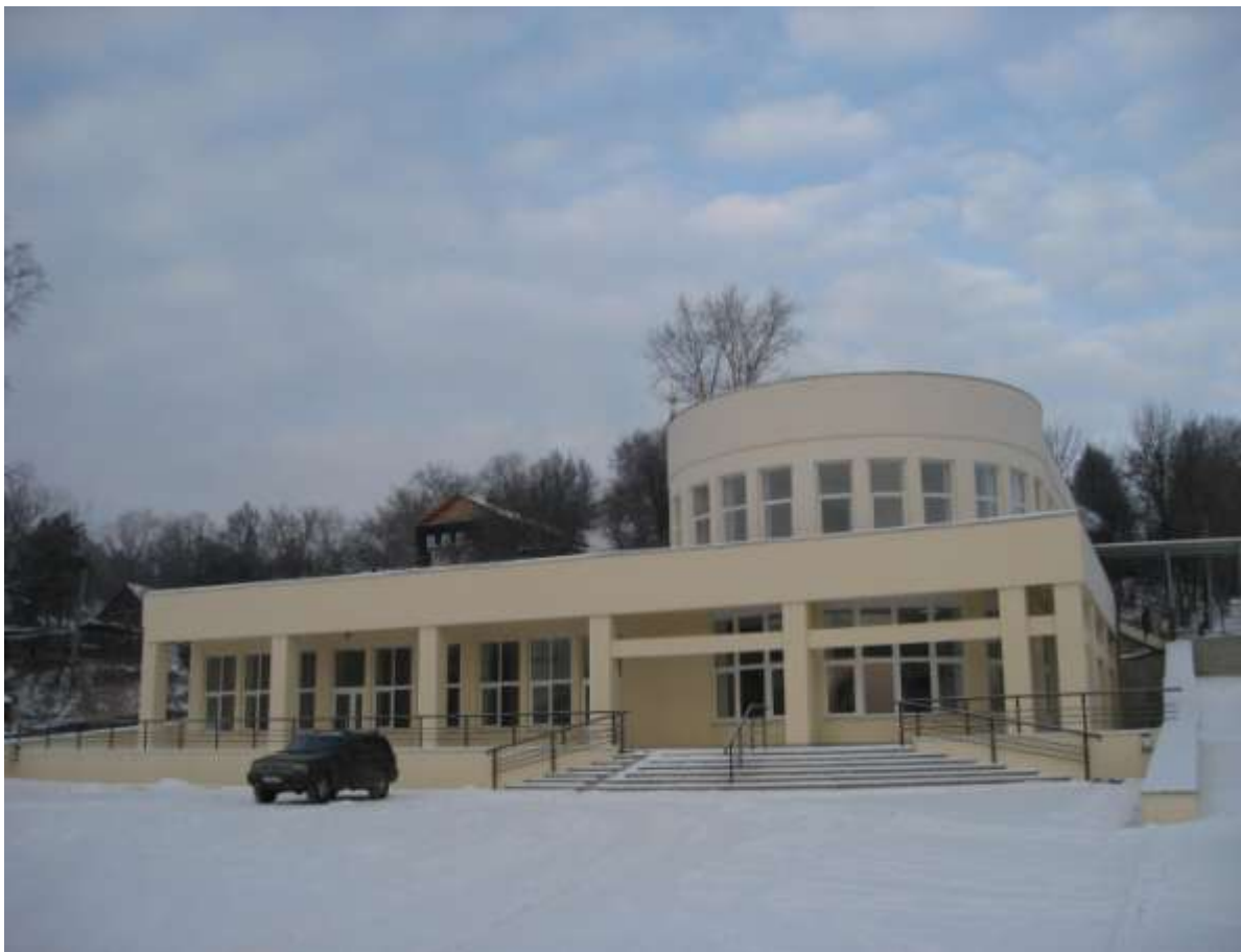
Автовокзал пропускной способностью 200 человек со стоянкой отстоя автобусов, ул.Вокзальная, д.1-а (заказчик: ООО «Артель-В»)