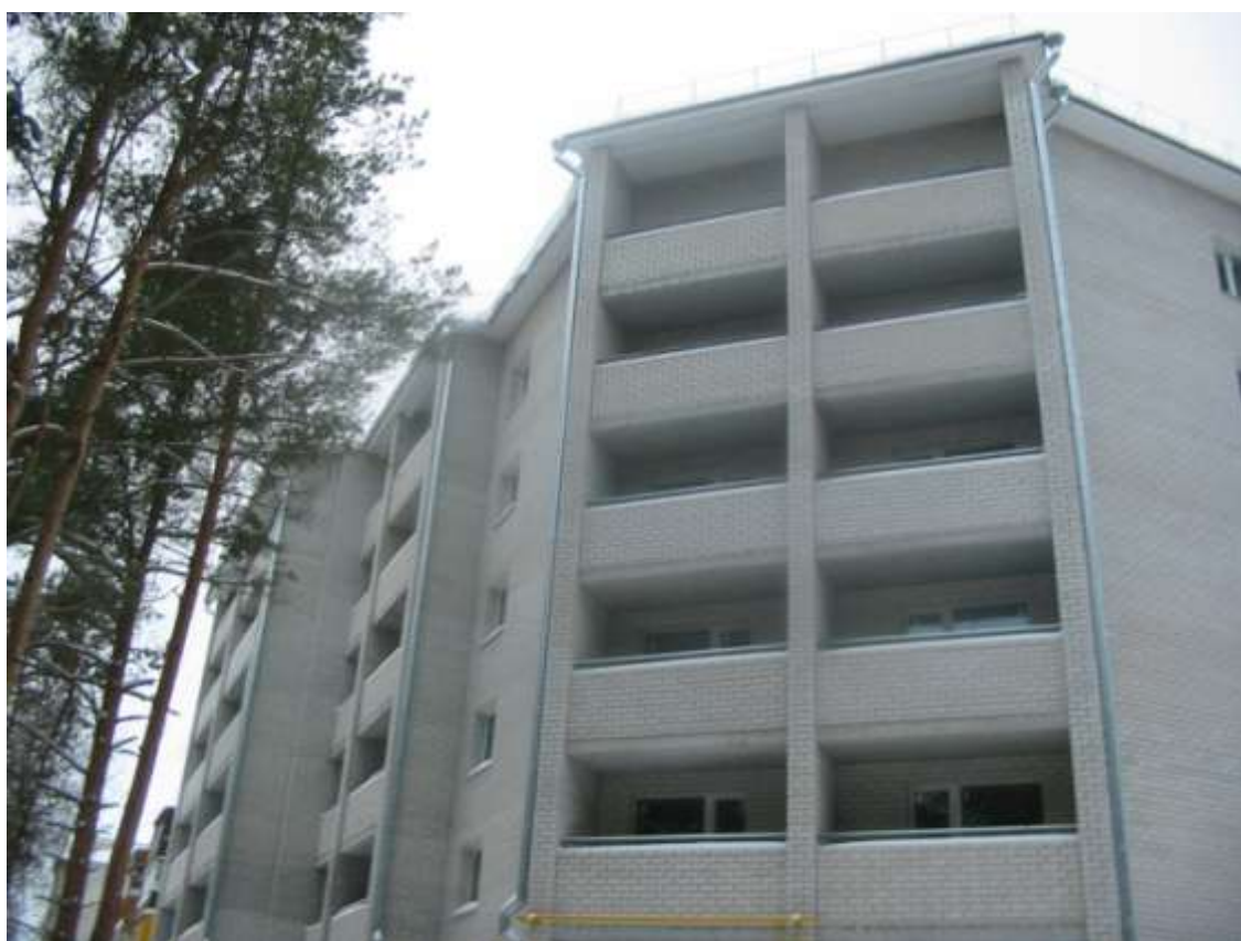
Пристройка к жилому дому № 29-а по Судогодскому шоссе (заказчик: ООО «СтройГарант»)