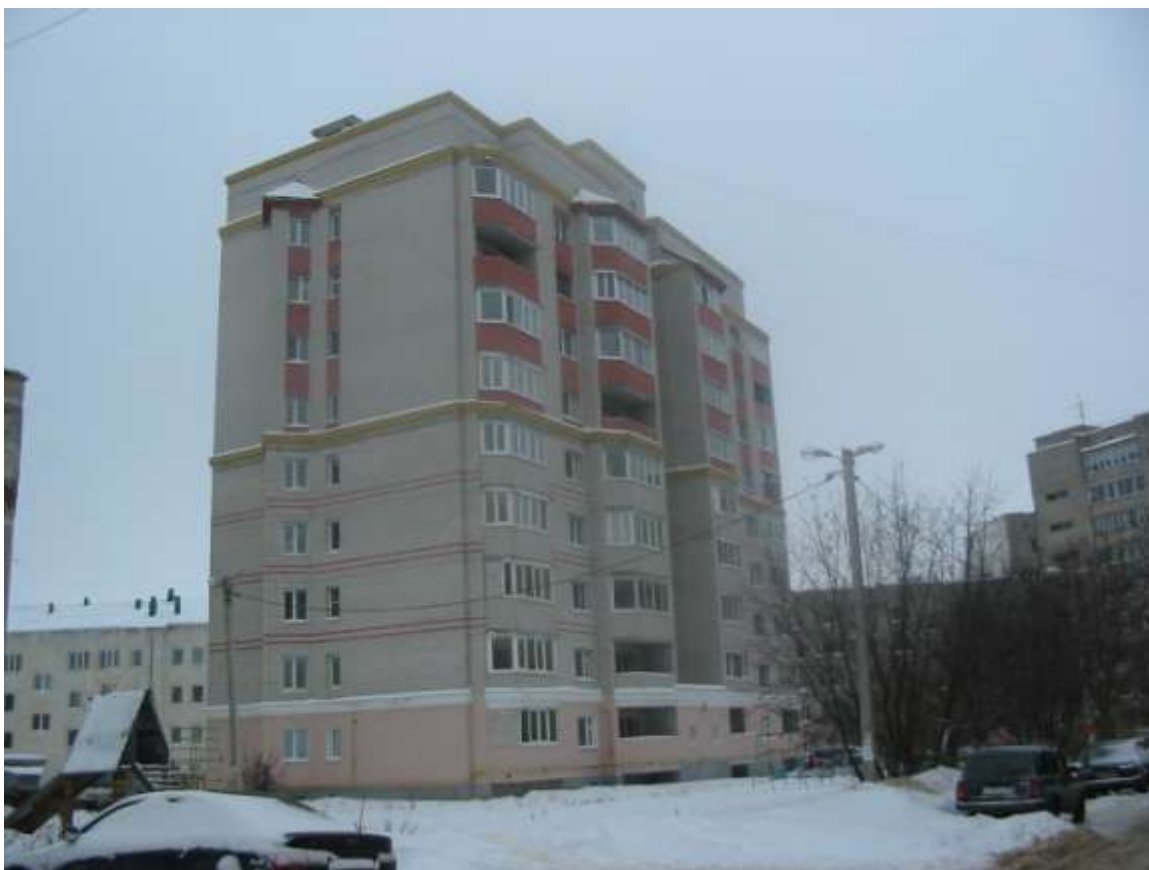
Жилой дом № 5а по ул.Диктора Левитана (заказчик: ООО «Кархарадон»)