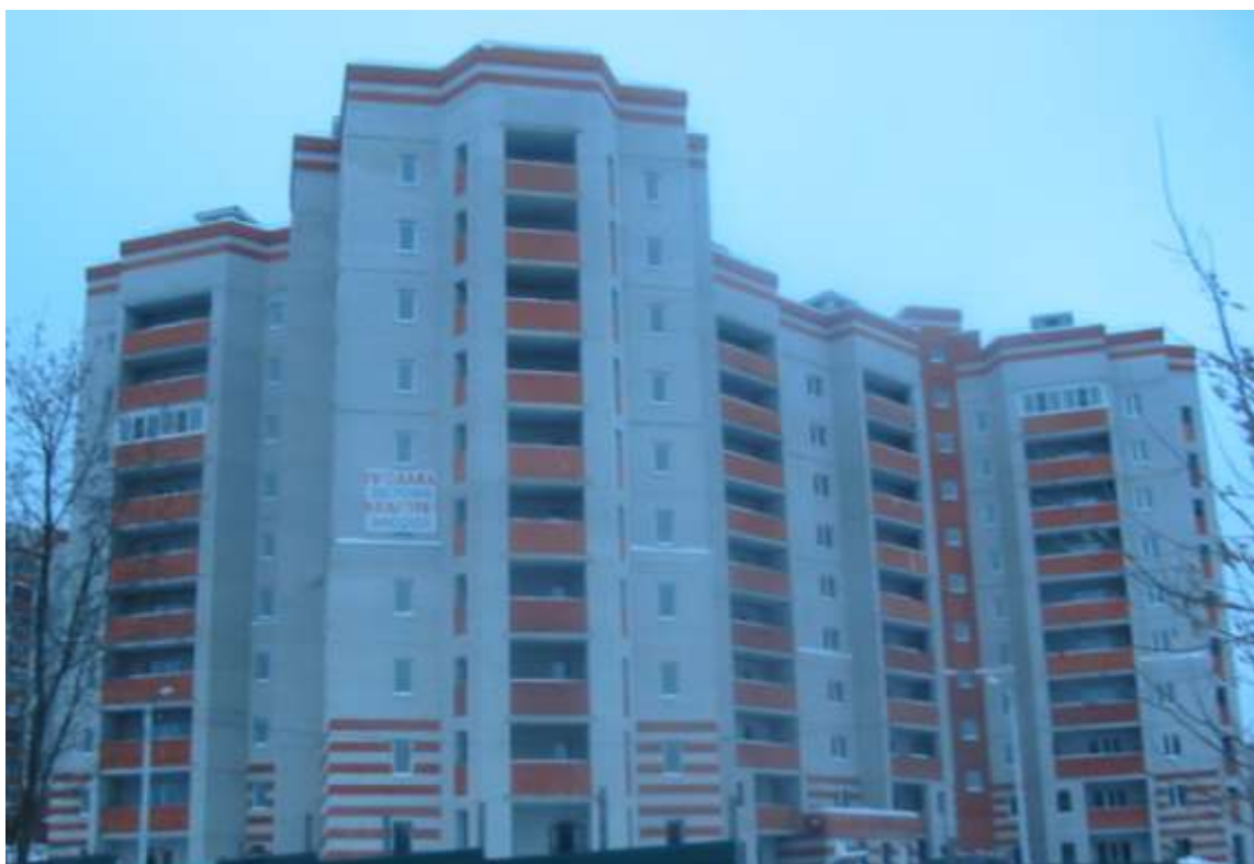
Жилой дом, ул.Мира, д.6-б (заказчик: ООО «СРез»)