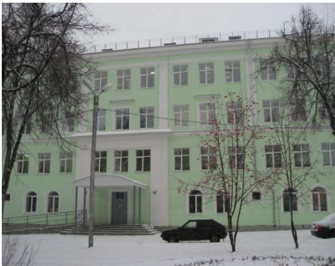
Средняя общеобразовательная школа № 6 после капитального ремонта, просп.Ленина, д.8 (заказчик: МБУ «Владстройзаказчик»)