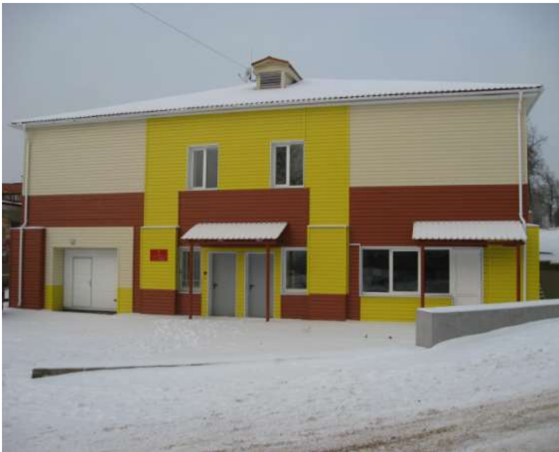
Административно-бытовой корпус (центр досуга), мкр.Оргтруд, ул.Октябрьская, д.26 (заказчик: ООО «ТехАвтоСнаб»)