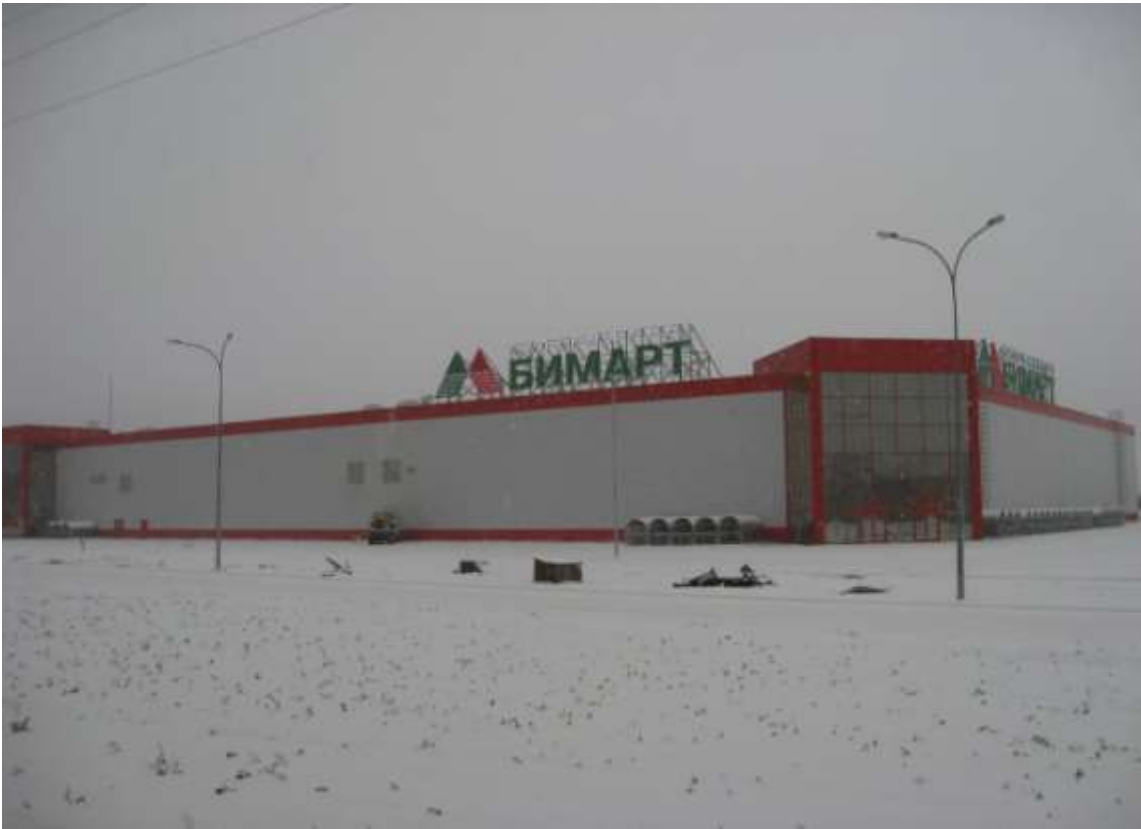
Торговый центр «Бимарт», Московское шоссе, д.2 (заказчик: ЗАО «Терминал Центр»)