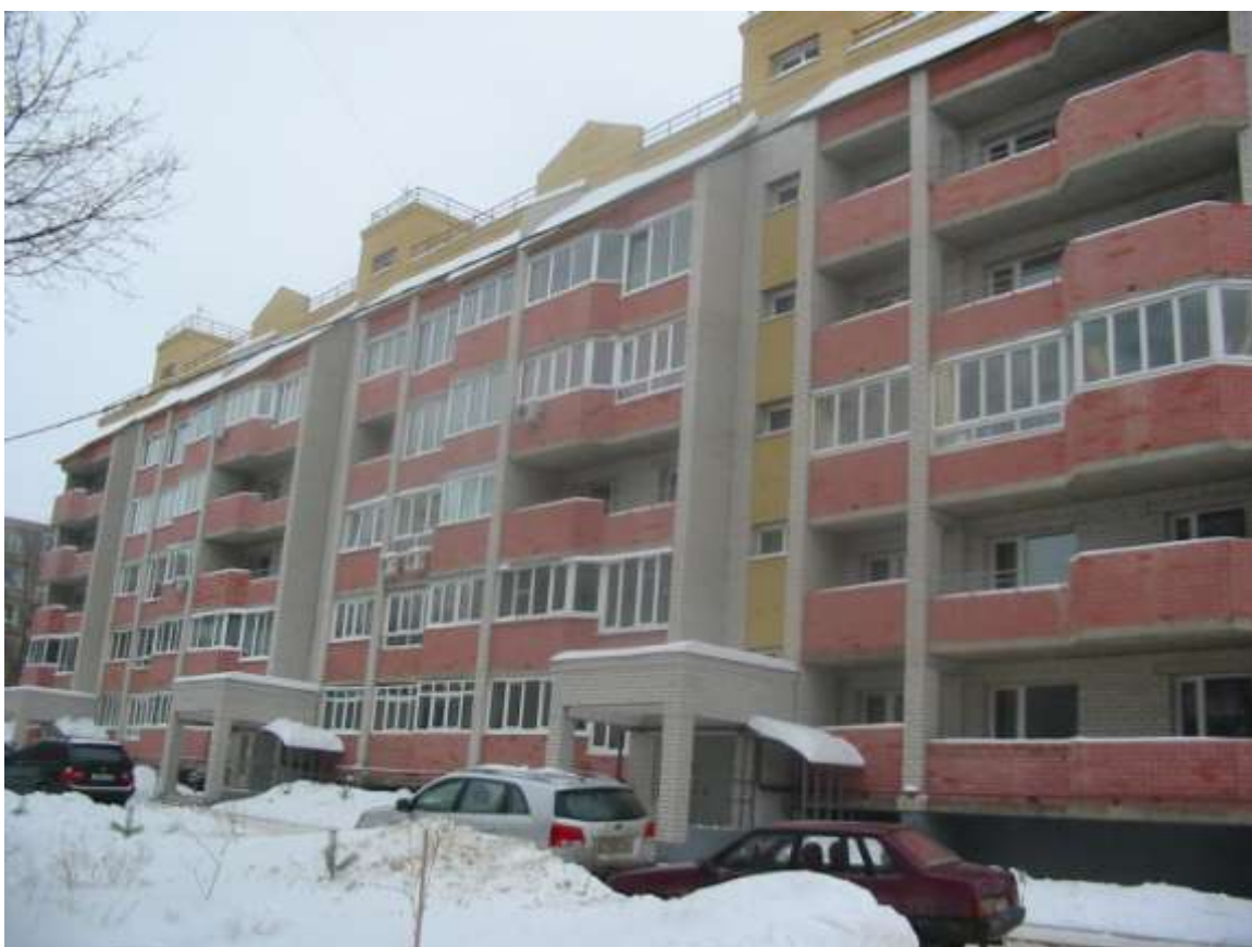
Жилой дом № 8-д, ул.Жуковского (заказчик: ООО «ВлаДос»)