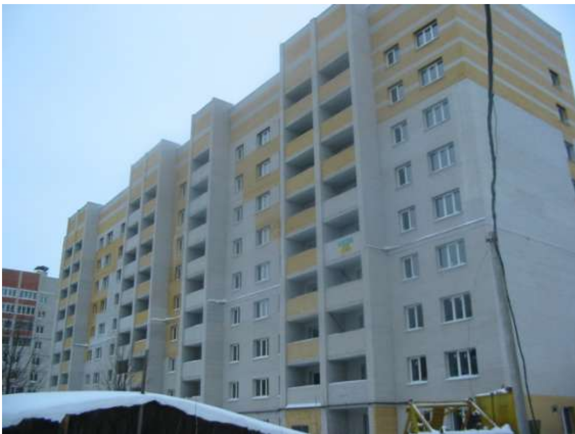
Жилой дом № 8 по ул.Народной (заказчик: ООО СК «МЕК»)