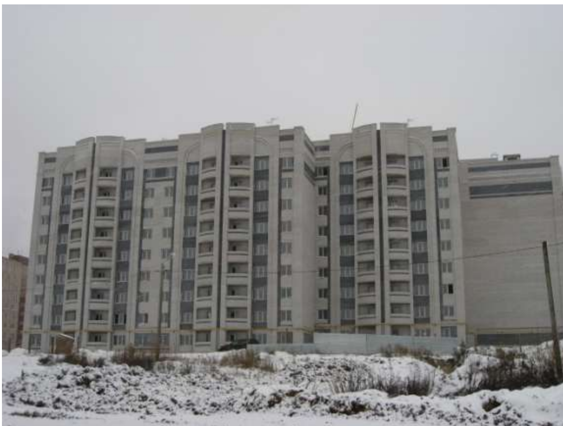
Социальный жилой дом, ул.Фатьянова, д.21 (заказчик: МБУ «Владстройзаказчик»)