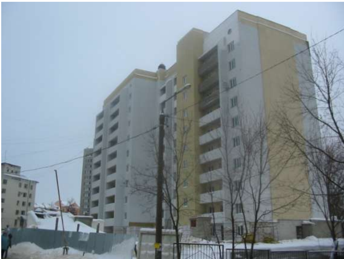
Многоэтажный жилой дом № 34-а по ул.Студеная Гора (заказчик: ООО «Золотой медведь-1»)