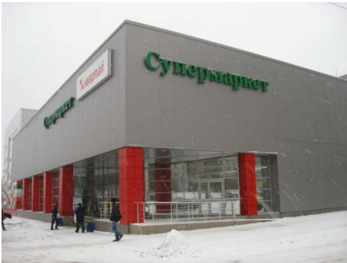
Торговый центр, ул.Верхняя Дуброва, д.36-а (заказчик: ООО «ЖФГ»)